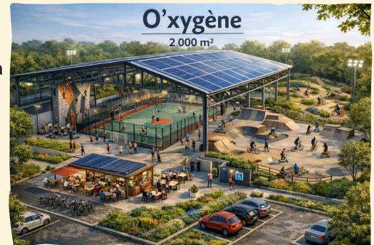
Située à proximité du centre-ville et accessible aux écoles, collèges et lycées.